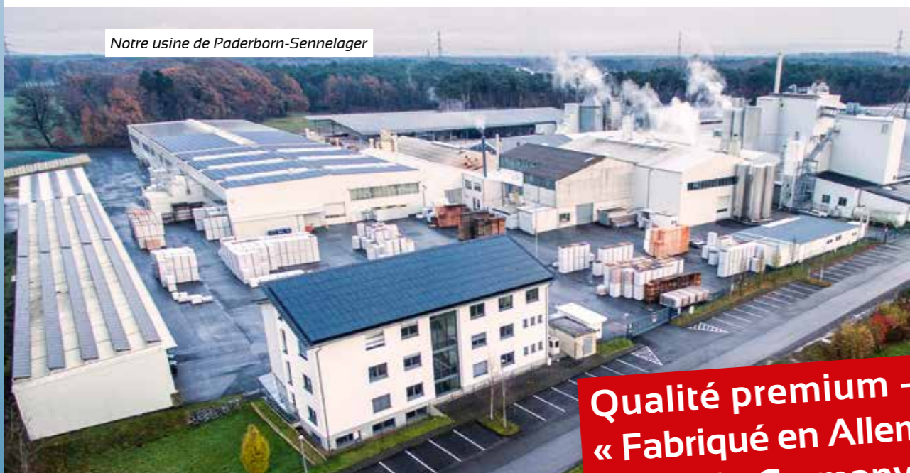
Notre usine de Paderborn-Sennelager

redstone est le fabricant innovant d'une gamme efficace de produits destinés à l'assainissement contre les moisissures et l'humidité, mais aussi la rénovation énergétique par l'isolation intérieure et l'amélioration du confort de vie. Les systèmes sont complétés et optimisés par des revêtements muraux minéraux et respectueux de l'environnement.